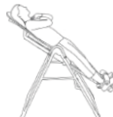
Положение при правильной балансировке

-Если Ваша голова ниже, чем Ваши стопы, увеличьте высоту основной оси на одно деление и повторите проверку